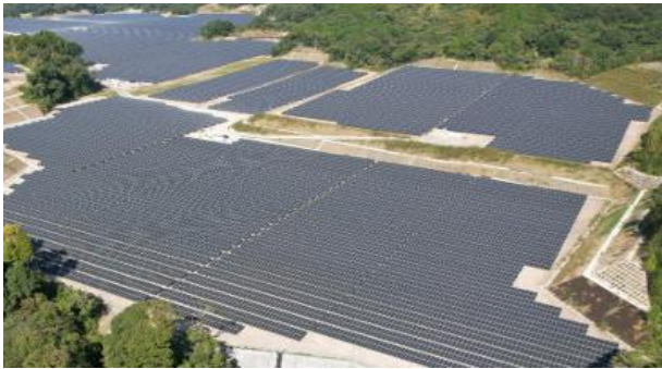
太陽光発電所の全景