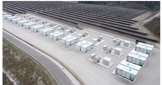
蓄電池設備の全景